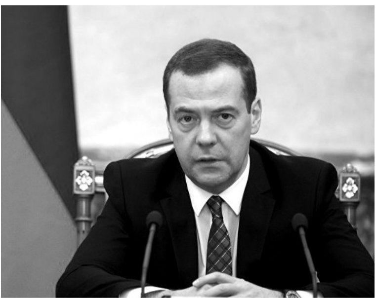
8 маялда, В.В. Путинил рекомендацаялда рекъон, Пачалихъияб Думаля Россиялзул х1укуматалзул председателъун Д.А. Медведев тасдикъ гъавуна.