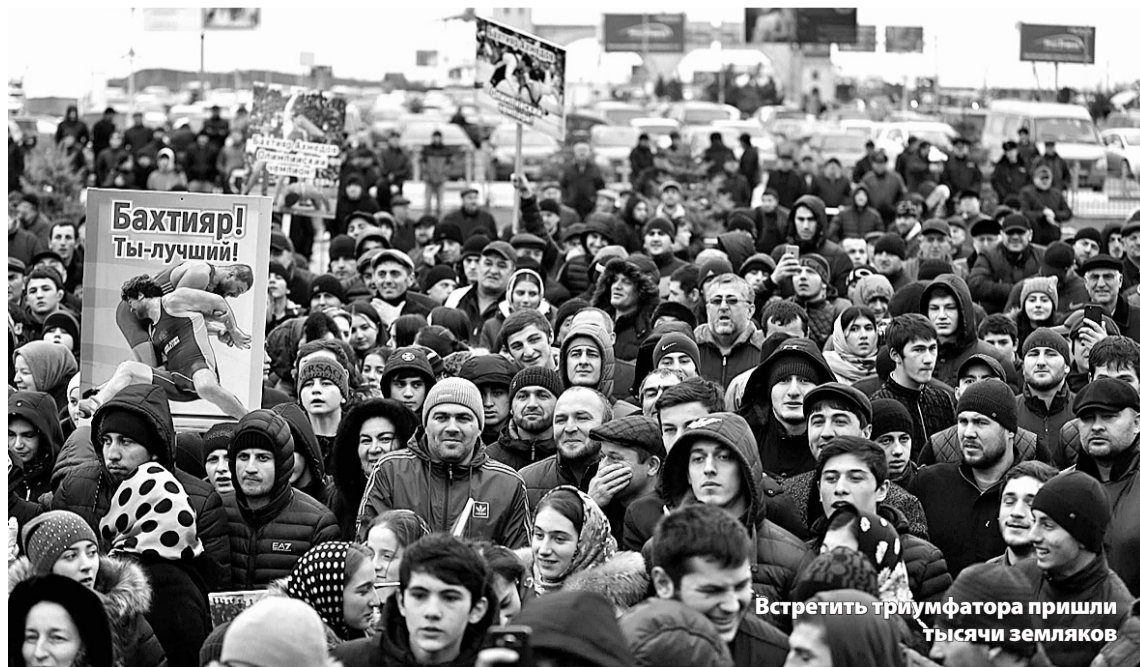
Встретить триумфатора пришли тысячи земляков

Нурмагомед АСТАРХАНОВ, «МИ» №50 (1389) от 14.12.2018 г.