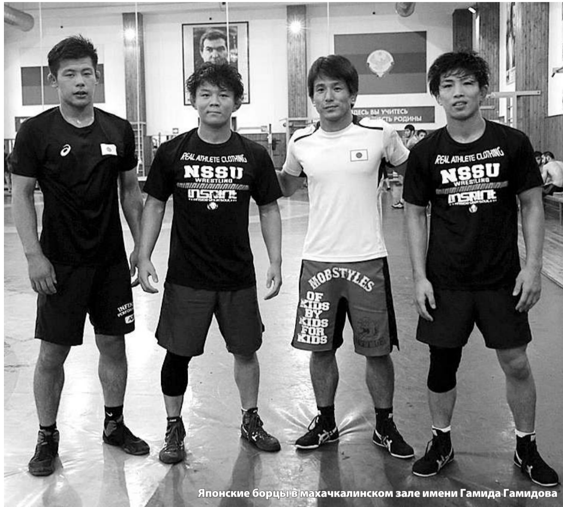
Японские борцы в махачкалинском зале имени Гамида Гамидова

Как японские борцы в Страну гор на сборы приезжали