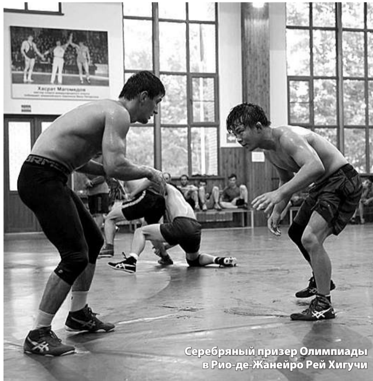
Серебряный призер Олимпиады в Рио-де-Жанейро Рей Хигучи