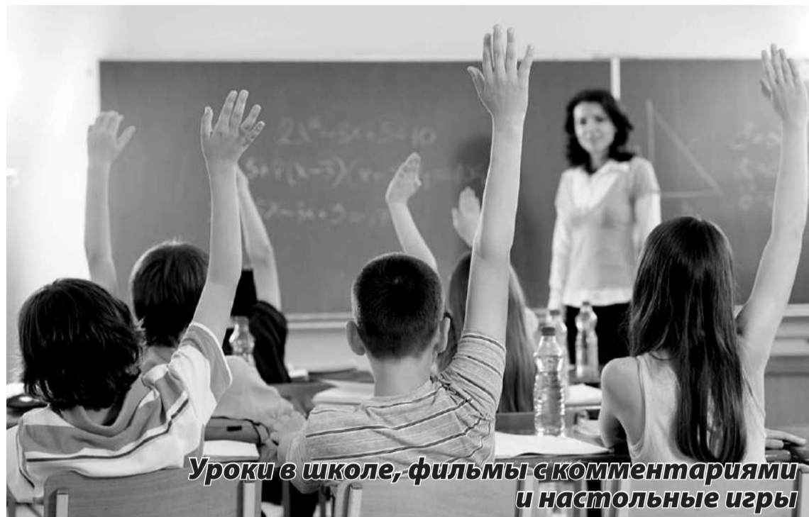
Уроки в школе, фильмы с комментариями и настольные игры

ция. Какие-то школы выполняют разрядку, приглашают к себе и радуются, что потом можно будет отчитаться.