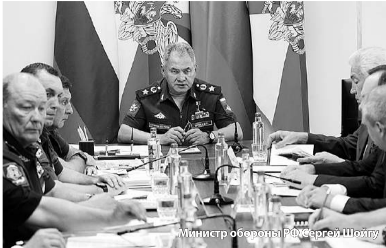
Министр обороны РФ Сергей Шойгу

Строительство военной инфраструктуры в Каспийске станет серьезным подспорьем и для развития самого города. Ожидается, что по итогам масштабной стройки в Каспийске появятся новые рабочие места. Ранее в интервью ТАСС мэр города Магомед Абдулаев заявлял, что в связи с передислокацией базы флотилии в городе появится около 5 тыс. рабочих мест. «В том числе около 2 тыс. гражданских специаль-