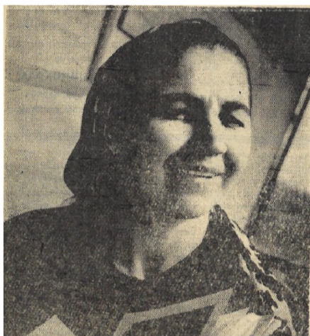
28 марта, 1971г.

Вечереет. В чистую и уютную библиотеку собираются работники ферм. Обсуждается вопрос о дальнейшем развитии животноводства на основе осуществления системы эффективных мер по укреплению кормовой базы. А кто интересуется литературой по затронутым вопросам, Калимат приготовит ее к следующему приходу.