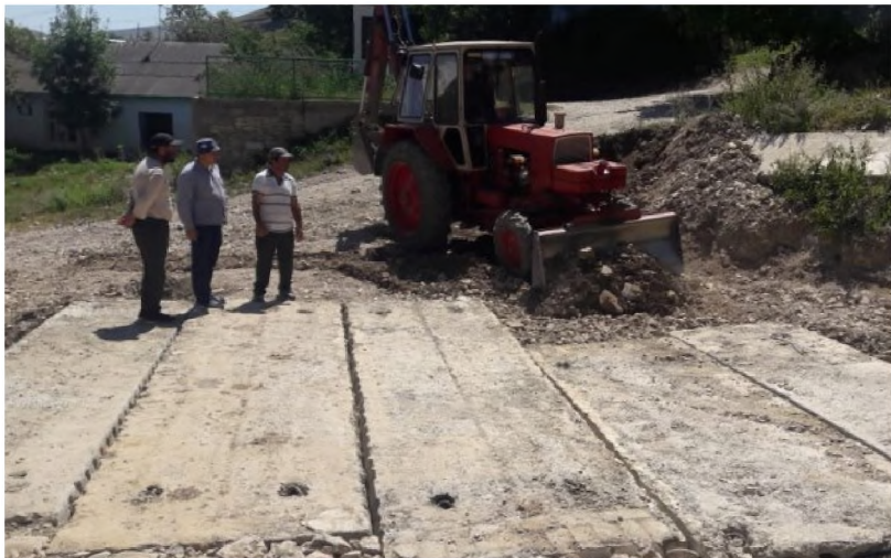
Два мостовых перехода в с. Аркас, разрушенные в результате схода селевого потока в 2016 году, восстановлены. Переходы про-