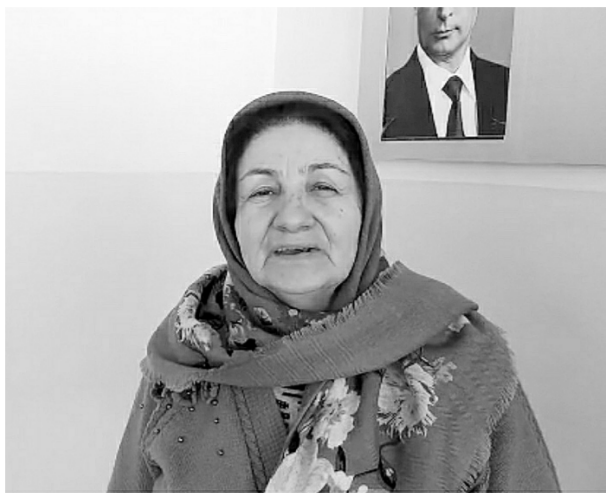
раля стало в 2002 году.

Официальным праздничным выходным 23 фев-