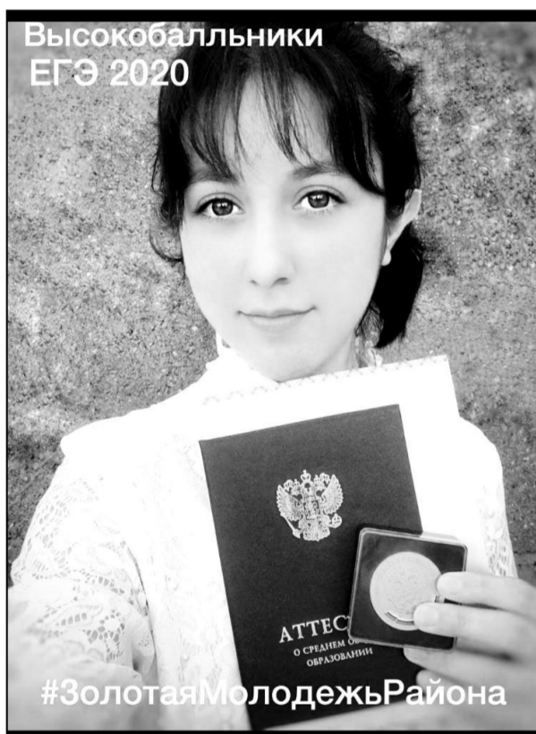
Высокобалльщики ЕГЭ 2020

Пусть эти знания непременно пригодятся тебе в будущем, пусть жизнь позволит тебе определиться с верными желаниями и заветными мечтами.