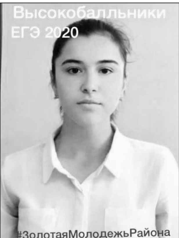
Высокобалльщики ЕГЭ 2020