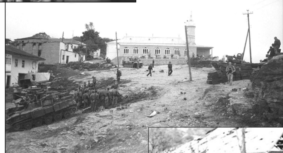
гибли, двоих ранило.

Благодаря его мужеству, храбрости, умелому командованию удалось предотвратить многие беды, которые могли обрушиться на жителей Новолакского района и другие пригра-