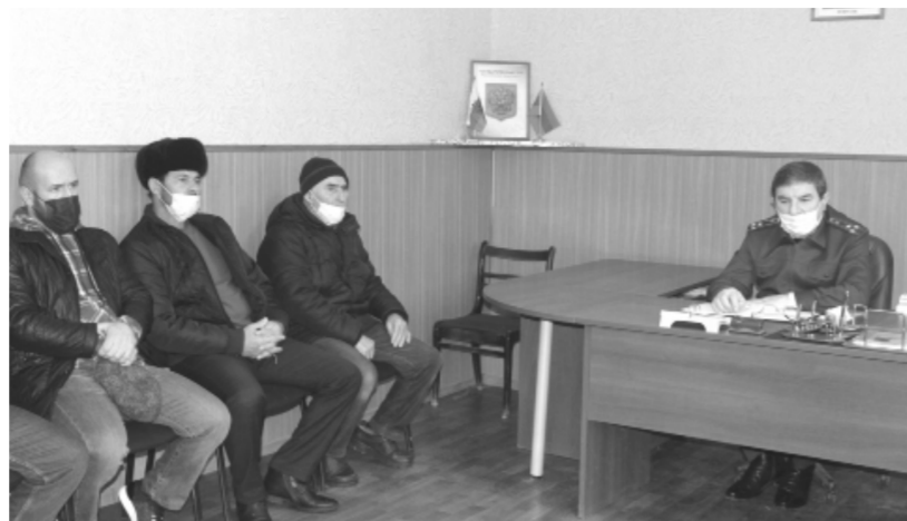
телства, в частности, о порядке выделения земельных участков, о некачественном состоянии автомобильных дорог, отсутствия водопроводных сетей и некачественном предоставлении электричества.

Обращения заявителей касались вопросов жилищного, земельного и дорожного законода-