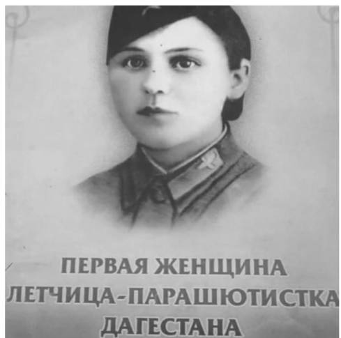
ПЕРВАЯ ЖЕНЩИНА ЛЕТЧИЦА-ПАРАШЮТИСТКА ДАГЕСТАНА

нилось 10 лет увидела аэроплан, он настолько поразил ее что она решает- буду летать.