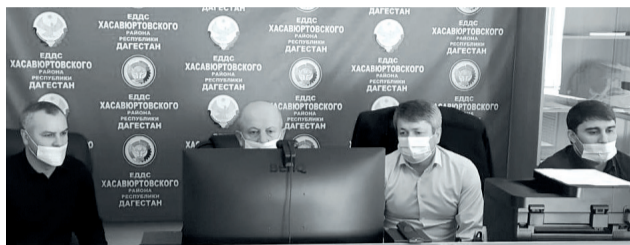
МКУ «Управление по делам ГО ЧС и МП» МО «Хасавюртовский район»

деню итогов деятельности республиканской подсистемы РСЧС по осуществлению