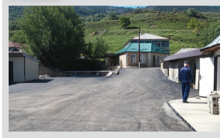
МачІада пайда цІикІкІарал ишал