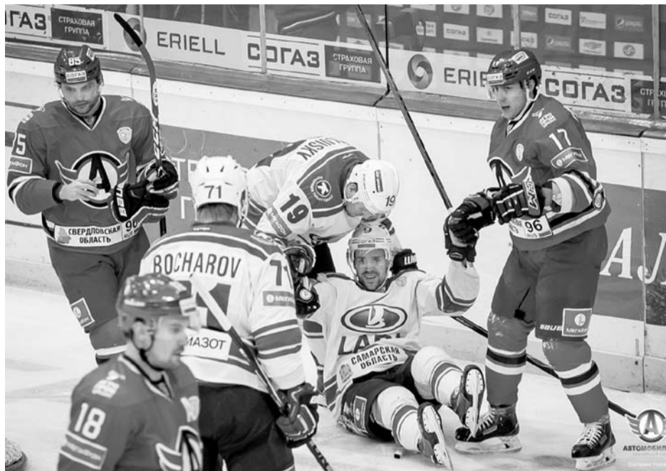
Альба Торренс набирает форму

5 февраля. Рига. Arena Riga. 7630 зрителей.