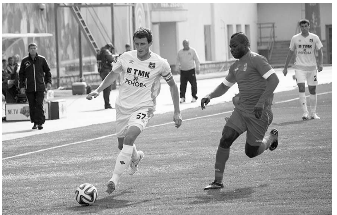
Сборная России — серебряный призер Паралимпиады по керлингу на колясках

«Урал» провел заключительный матч на учебно-тренировочном сборе. «Шмели» сыграли с футбольным клубом