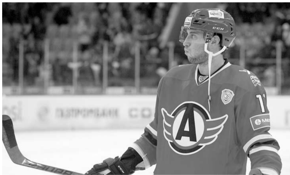
Альба Торренс набирает форму

Шайбы забросили: 0:1 — Гункес (Бочаров, 04:52), 1:1 — Лепистё (Рыбаков, Симаков, 10:55), Валуйский — победный буллит.