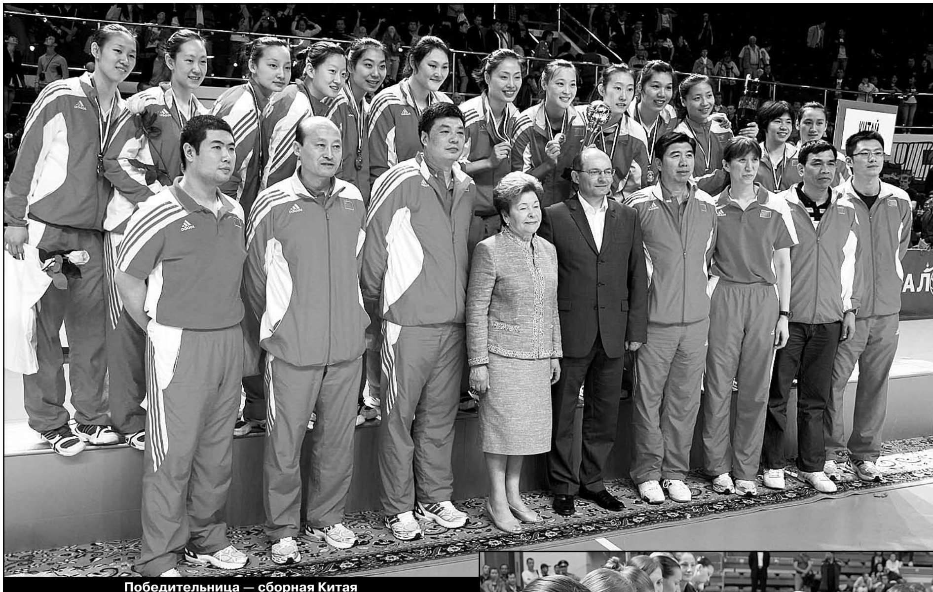
Победительница — сборная Китая

Россия — Китай — 1:3 (22:25, 23:25, 25:23, 23:25).