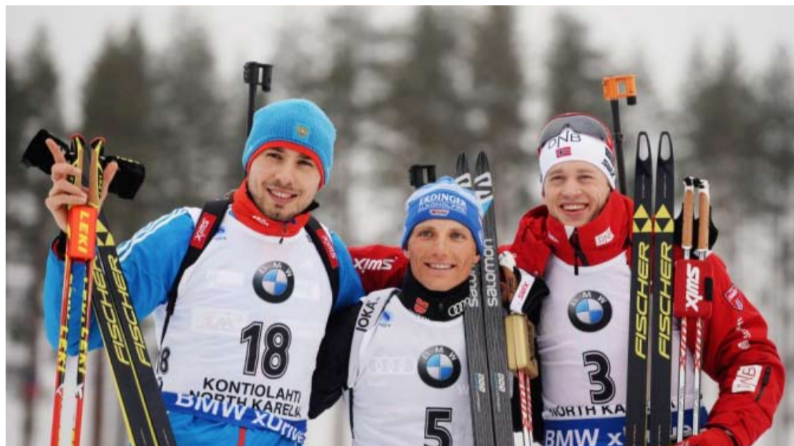
Победители гонки преследования: Антон Шипулин, Эрик Лессер, Тарье Бе

— К слову, вы выиграли третью подряд медаль в пасьете на чемпионатах мира. За что так любите эту дисциплину?