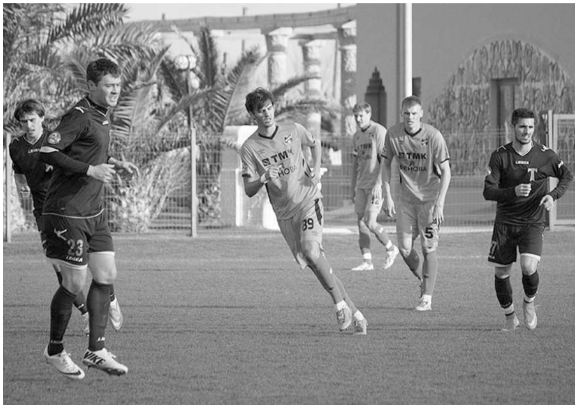
Эпизод матча «Урал» — «Торпедо»