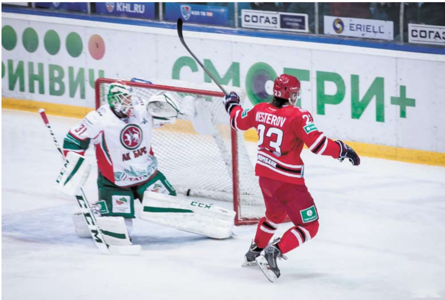
Гол Александра Нестерова

заходит на пресс-конференцию, но на него просто страшно смотреть. Так выглядит лицо человека, который только что проиграл в казино Лас Вегаса все состояние!