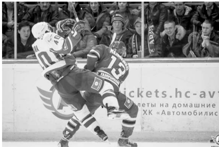
Бьются, как звери

На финальной минуте матча «Автомобилист» устроил настоящий штурм ворот Нильссона, бросок за пять секунд до конца матча прошелся чуть выше штанги. Но сравнять счет — не получилось.