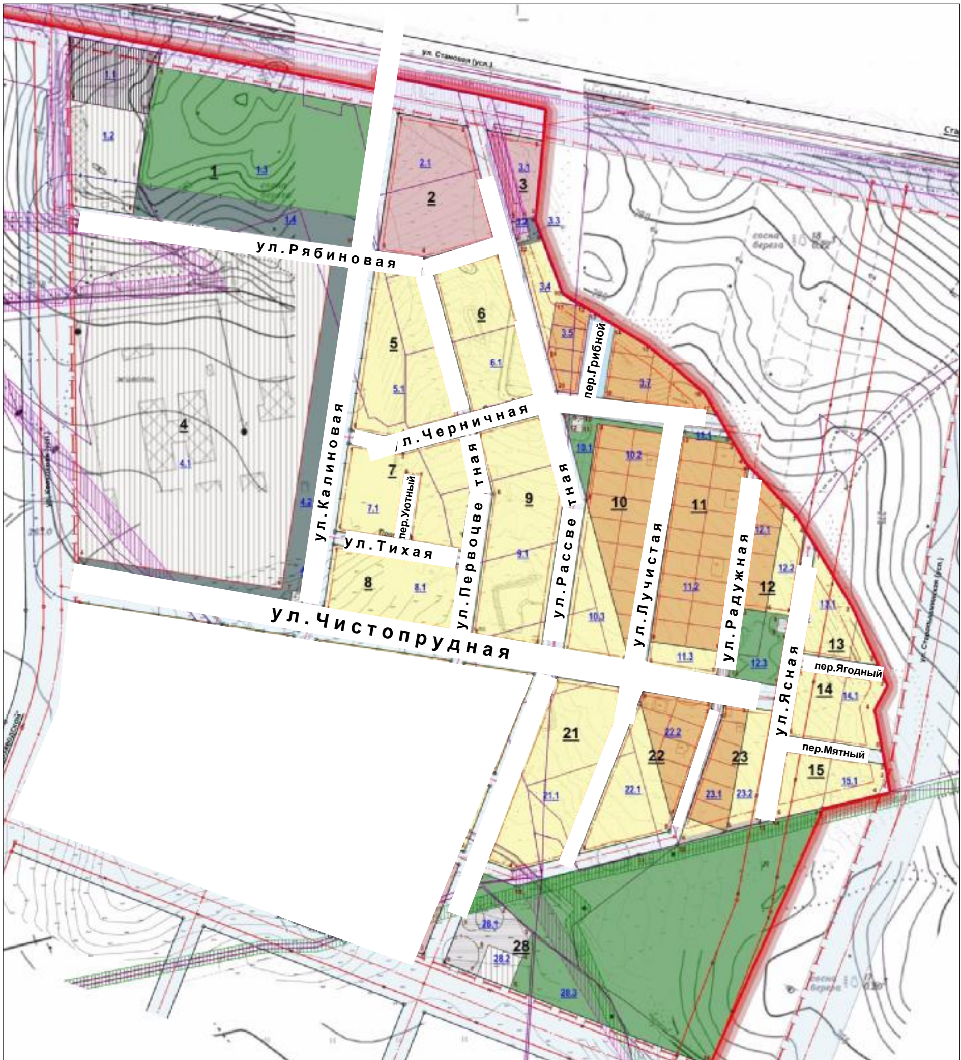
Схема расположения новых улиц

Приложение к постановлению администрации Березовского городского округа от _____ № _____