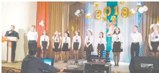
День последнего звонка в Соловьёвской школе

Дорогие выпускники! Поздравляем вас с днём последнего школьного звонка! Впереди у вас волнительная пора экзаменов, испытаний и первых успехов. Желаем удачи, настойчивости и упорства в достижении постав-