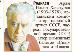
Родимся Арам Ильич Ханачатурян (1903-1978), армянский композитор, народный артист СССР, лауреат Государственной премии СССР, автор знаменитых балетов «Спартак» и «Гаянэ».

РЕН-ТВ 05.00 «Территория заблуждений» 16+ 06.00, 11.00 «Документальный проект» 16+ 07.00 «С бодрым утром!» 16+ 08.30, 12.30, 16.30, 19.30, 23.00 «Новости» 16+ 09.00 «Территория заблуждений» 16+ 12.00, 16.00, 19.00 «112» 16+ 13.00 «Загадки человечества» 16+ 14.00 «Засекреченные списки» 16+ 17.00, 03.15 «Тайны Чапман» 16+ 18.00 «Самые шокирующие гипотезы» 16+ 20.00 Х/ф. «Колония» 16+ 21.45 «Смотреть всем!» 16+ 23.25 «Загадки человечества» 16+ 00.30 Х/ф. «Готика» 18+ 02.15 «Самые шокирующие гипотезы» 16+ 04.10 «Территория заблуждений» 16+