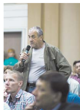
На встрече жители города подняли вопрос отопления в удаленных микрорайонах Тынды – ЦРММ, СМУ-3 и Западный (район АТП)

На встрече затронули вопросы строительства приюта для бездомных животных, несанкционированных свалок и утилизации мусора, организации медпомощи в Тынде и авиасообщения между Тындой и Благовещенском, капитального ремонта и замены лифтов (в прошлом году было заменено 25 подъемных механизмов в 11 многоквартирных домах, в дальнейшем предстоит заменить еще 14), текущего ямочного ремонта