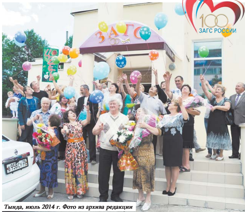
Тында, июль 2014 г.

Именно священником записывались в метрической книге следующие сведения: имена и фамилии вступающих в брак, время совершения таинства брака, год, месяц и день рождения жениха и невесты, их вероисповедание, их семейное состояние до времени вступления в брак, их сословие, место жительства жениха, его занятие (а также занятия невесты, «если перед браком она само-