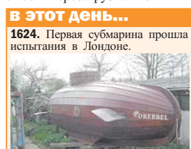
В ЭТОТ ДЕНЬ... 1624. Первая субмарина прошла испытания в Лондоне.

В ЭТОТ ДЕНЬ... 490 до н.э. Греческий воин Фидиппид пробежал от города Маратон до Афин, принёс весть о победе греков над персами — «Ликуйте! Мы победили» и умер.