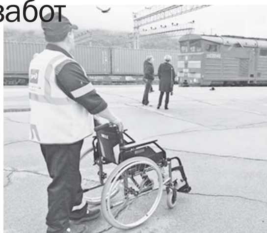
Работники вокзала оказывают всяческую поддержку маломобильным пассажирам

На корпоративном сайте ОАО «РЖД» в разделе «Пассажирам с ограниченными физическими возможностями» представлен подраздел «Помощь на вокзалах» с информацией об услугах и льготах, предоставляемых маломобильным пассажирам, а также электронной картой доступности вокзалов России. С её помощью гости