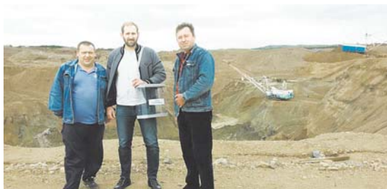
Досрочное голосование в с. Соловьёвск