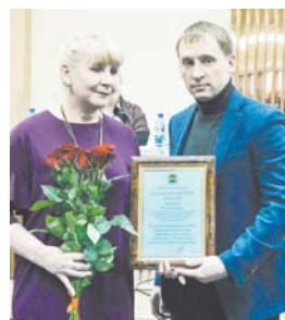
Александр Козлов вручает благодарственное письмо

Итогом встречи губернатора с населением стало поручение министерству имущества проверить рационального использования муниципального имущества в Тынде. А министерству внешнеэкономических связей, туризма и предпринимательства — провести работу по опросу предпринимателей по поводу дифференцированной ставки на имуществовый налог. Сейчас в Тынде принят именно такой подход (до 1,5%), но