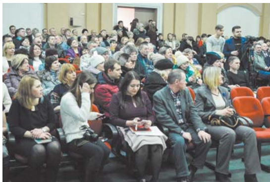
На встрече с губернатором

Много вопросов вызвало состояние нашего здравоохранения. Жители города и, будем скрывать, района обеспокоены закрытием ведомственной медицины и слухами, что районную больницу ждёт очередной (сколько их было за последние 20 лет!) переезд. Так, к 1 мая в Тынде обещают закончить ремонт и комплектацию детской поликлиники.