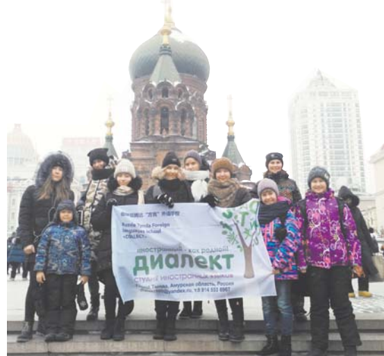
У собора св.Софии