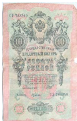
Кредитный билет 10 рублей образца 1909 г. Управляющий И. П. Шипов

гах. К тому же в апреле случилась забастовка Экспедиции заготовления государственных бумаг, во время которой Государственному банку пришлось выпустить в обращение весь запас кредитных билетов. В связи с этим Временное правительство, с подачи управляющего Государственным банком И. П. Шипова, 9 мая 1917 г. (по юлианскому стилю) издало постановление об изготовлении 5-рублевых кредитных билетов образца 1909 г. с упрощенной серийной нумерацией, аналогичной уже изготовлявшимся кредитным билетам в 1 рубль образца 1898 г. Серийная нумерация давала возможность значительно ускорить изготовление банкнот, т.к. не нужно было нумеровать каждую бумажку – они печатались по миллиону штук с общим серийным номером. В качестве первой серийной литеры для 5 рублей была принята буква «У», что, вероятно, подразумевает слово «упрощенная». Вторая литера «А» – собственно и есть непосредственное обозначение серии, которая позже, уже в 1918 г. сменилась на букву «Б». Первая цифровая серия имела обозначение «УА-001», вторая «УА-002», третья «УА-003», а вот с четвертой произошел курьезный случай. В нижней части билета серия была напечатана правильно – «УА-004», а в верхней литеры перепутали местами, и получилась «АУ-004».