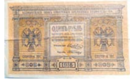
Казначейские знаки Сибирского временного правительства 1918 г.

Отпечатаны типографским способом на тонкой бумаге без водяных знаков.