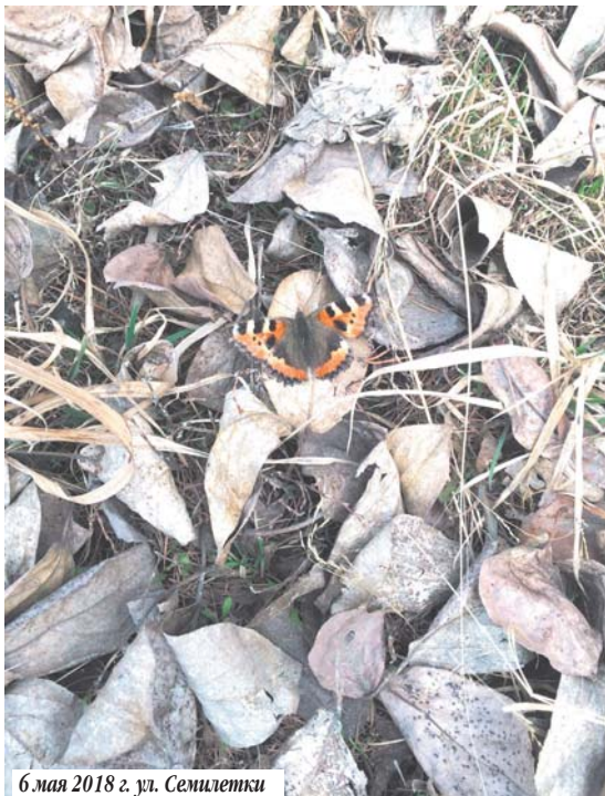
6 мая 2018 г. ул. Семилетки