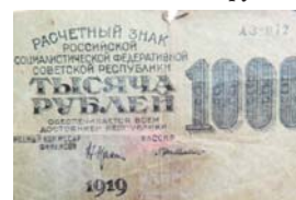
Расчётный знак 1000 рублей