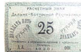
Расчетный знак ДВР 1920 г. Отпечатан типографским способом без водяных знаков.