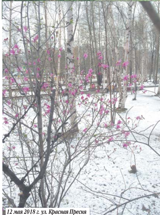
12 мая 2018 г. ул. Красная Пресня