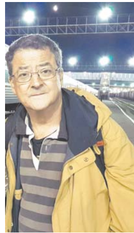
Вера Калугина Посол Швейцарии в России господин Ив Россье

Иностранные гости с любопытством рассматривали многочисленные экспонаты музея, интересовались богатствами, которые хранятся в недрах русской земли, а также задавали вопросы о перспективах развития БАМа. По окончании экскурсии туристы оставили в гостевой книге музея восхищенные отзывы о героическом труде строителей уникальной магистрали и пожелали дальнейших успехов в развитии России.