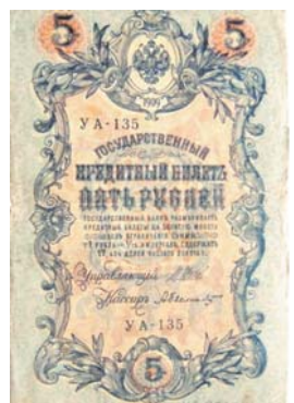
Кредитный билет 5 рублей образца 1909 г. Управляющий И. П. Шипов

На лицевой и оборотной сторонах размещен Малый Государственный герб образца 1883 года. Государственный кредитный билет 1 рубль 1898 года – бумажный денежный знак Российской империи, который появился в результате денежной реформы 1895-1897 г. Кредитные билеты 1 рубль 1898 года и 1 рубль 1898 года с упрощенной нумерацией находились в обращении до 1 октября 1922 года, когда согласно декрету Совета народных комиссаров от 8 октября 1922 года «Об установлении однородности денежного обращения» потеряли платежную силу. Обмен их производился из расчета 10000 рублей за 1 рубль денежными знаками образца 1922 года.