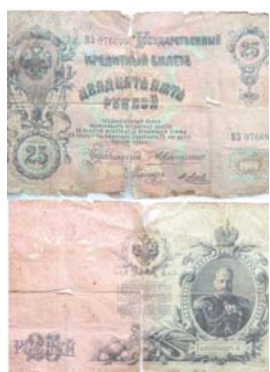
Кредитный билет 25 рублей образца 1909 г. Управляющий А. В. Коншин

Билет 10 рублей образца 1909 года находился в обращении до 1 октября 1922 года. Согласно декрету СНК от 8 сентября 1922 года «Об установлении однородности денежного обращения» он терял платежную силу с октября 1922 года. Обмен их производился из расчета 10000 рублей за 1 рубль образца 1922 года.