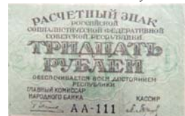
Расчётный знак 30 рублей.

В целях увеличения в обращении количества денежных знаков средних достоинств и для облегчения крупных расчетов в 1919 году выпускаются в обращение денежные знаки нового образца достоинством в 15, 30 и 60 руб. под наименованием «Расчетные Знаки Российской Социалистической Федеративной Республики».