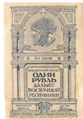
Кредитные билеты ДВР 1920 г. Отпечатан типографским способом на тонкой бумаге без водяных знаков.