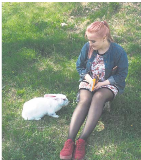
18 мая 2018 г. ул. Школьная