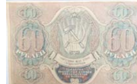
Расчётный знак 60 рублей