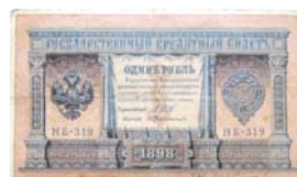
Кредитный билет 1 рубль образца 1898 года

На лицевой и оборотной сторонах размещен Малый Государственный герб образца 1883 года. Государственный кредитный билет 1 рубль 1898 года – бумажный денежный знак Российской империи, который появился в результате денежной реформы 1895-1897 г. Кредитные билеты 1 рубль 1898 года и 1 рубль 1898 года с упрощенной нумерацией находились в обращении до 1 октября 1922 года, когда согласно декрету Совета народных комиссаров от 8 октября 1922 года «Об установлении однородности денежного обращения» потеряли платежную силу. Обмен их производился из расчета 10000 рублей за 1 рубль денежными знаками образца 1922 года.