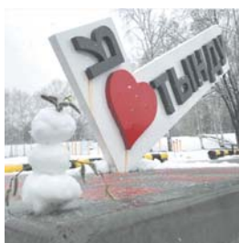
12 мая 2018 г.