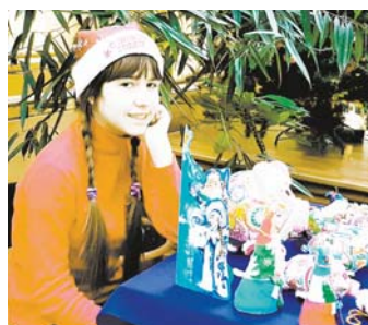
Юная участница ярмарки