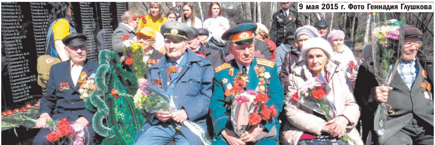
9 мая 2015 г.