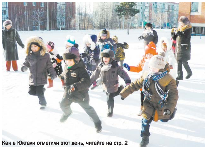
Как в Юктали отметили этот день, читайте на стр. 2

Проходит под девизом: «Насладиться, ознакомиться и испытать!».