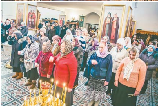
В соборе Святой Троицы, 19 января