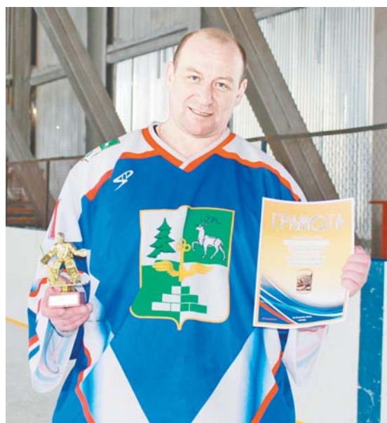
Железнодорожник из Тынды не представляет своей жизни без хоккея

– До 2009 года весь локомотивный комплекс Тынды был единым целым. После разделения предприятия на ремонт и эксплуатацию я стал работать главным инженером ремонтного депо, – рассказыва-