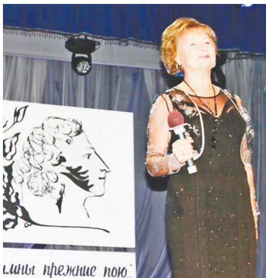
дожественный руководитель Августа Бурлакова).

Бурными аплодисментами сопровождалась танцевальная программа образцового хореографического ансамбля «Россияне» (художественный руководитель Ирина Дюкарева) и выступления вокалистов детской образцовой вокальной студии «Музей Пушкина» (ху-