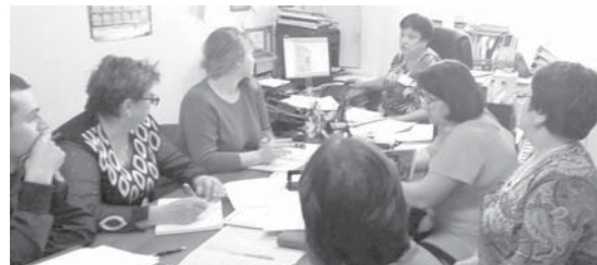
На очередном заседании инициативной группы

Был разработан проект, составлена смета. К участию в программе было решено привлечь организации, находящиеся на территории Моготского поселения. В результате опроса и сами жители изъявили желание принять долевое участие в финансировании и оказании физической помощи в осуществлении этого проекта. По просьбе главы администрации посёлка часть работ по воплощению нашей за-