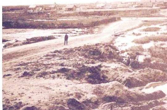
Село Уркан 1930-е годы

26 сентября 1937 года Зейская область была ликвидирована, а города и районы, входившие в её состав, в том числе и Желтулакский район, присоединены к вновь образованной Читинской области.