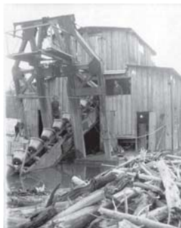
Село Уркан 1930-е годы. Первая (деревянная) драга

Сегодня на территории Тындинского района – 24 населённых пункта, объединённых в 20 муниципальных образований, являющихся сельсоветами: Аносовский, Бельский, Восточный, Дипкунский, Курьютинский, Ларбинский, Лопчинский, Маревский, Моготский, Муртыгитский, Нюкжинский, Олекминский, Первомайский, Соловьёвский, Тутаульский, Урканский, Усть-Нюкжинский, Хорогочинский,