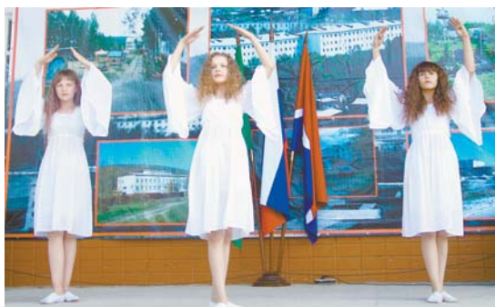
Участницы коллектива «Звёздочка»

На митинге, посвящённом Дню России, прозвучал рассказ об истории возникновения праздника, поскольку каждый гражданин должен знать героическое прошлое своего государства и быть ответственным за его будущее.