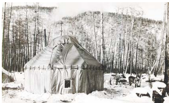
Красная палатка на оленеводческом стойбище