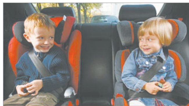
СОХРАНИ СВОЕ БУДУЩЕЕ, ЧТОБЫ ОНО НЕ СТАЛО ПРОШЛЫМ!

Основные причины, которые приводят к совершению аварий, в том числе и с участием юных пассажиров – это непредоставление преимуществ в движении транспортным средствам, неуважительное отношение к другим участникам дорожного движения со стороны как водителей, так и пешеходов, управление в состоянии опьянения, выезд на сторону дороги, предназначенной для встречного движения, невнимательность, в том числе разговоры по мобильному телефону, не оборудованному техническим устройством, позволяющим вести переговоры без использования рук. А серьезные травмы в ДТП юные пассажиры получают из-за того, что их