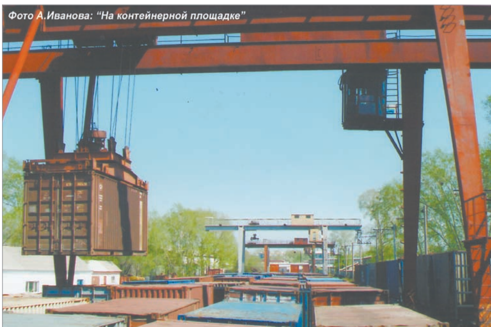
"На контейнерной площадке"

По названию дистанции вполне можно предположить, что основная специальность среди ра-