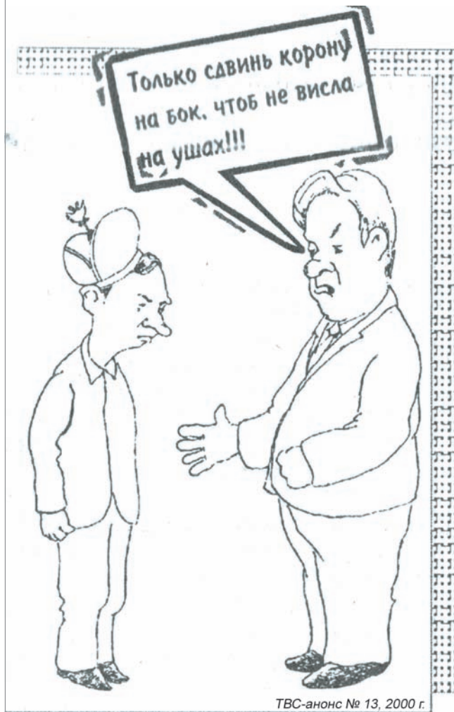
ТВС-анонс № 13, 2000 г.

Сколько было «критических» материалов в его СМИ по поводу прихода Владимира Владимировича