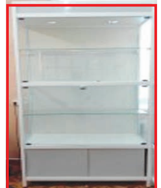
ПРОДАЕТСЯ ТОРГОВАЯ ВИТРИНА РАЗМЕР 220X100X40 8-914-041-33-33

Мужчина 63 года, познакомится с женщиной , порядочной, не пьющей. Тел. 8-914-044-98-63