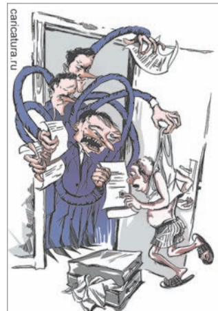
Не пошёл на выборы? Остался дома? А завтра за долги лишат тебя кроват!

Все траты лягут, в итоге, на конечного потребителя – на нас с вами. Мы будем из своего кармана оплачивать растущие цены в магазинах, поскольку всё давно уже свелось исключительно к торговле. Мы будем оплачивать постоянно увеличивающиеся тарифы. Додать свой будем искать в постоянных «кальмах» и