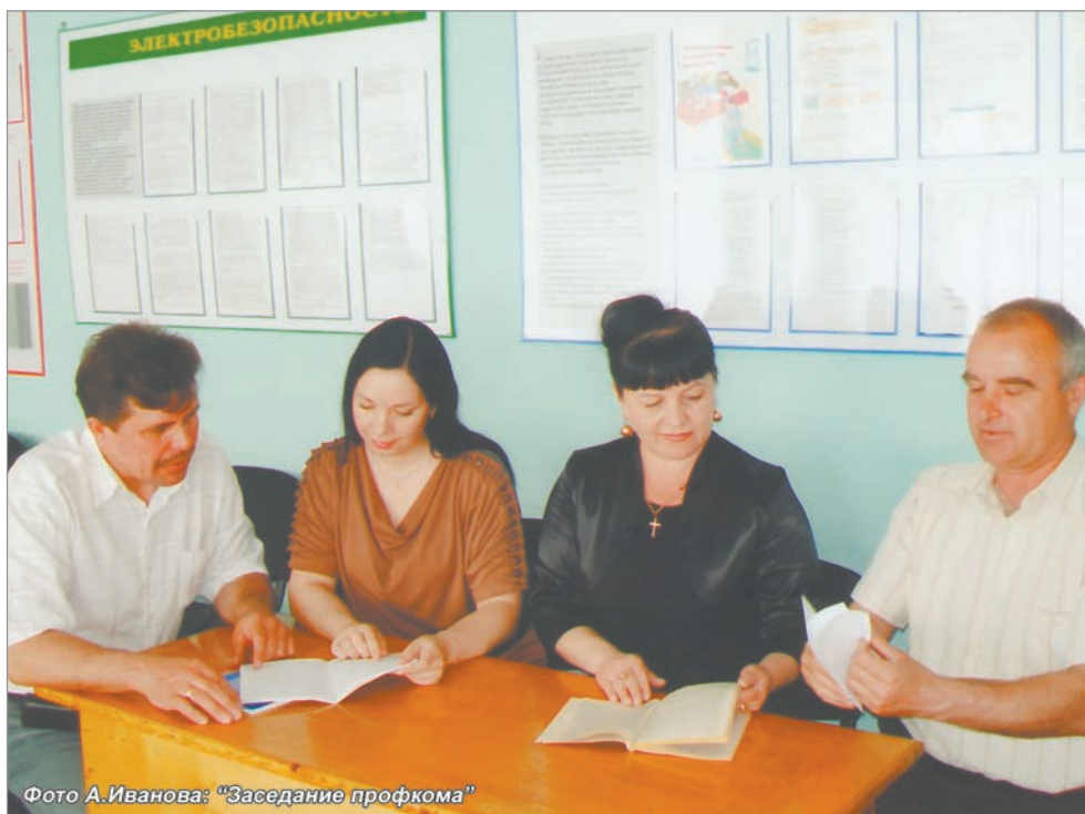
"Заседание профкома"

Всегда с теплотой, душевностью рассказывают о своих ветеранах в коллективе Белогорской дистанции. Сейчас в общественной организации уважаемых, заслуженных людей, которые долгие годы трудились на Забайкальской магистрали, - 190 человек, которые проживают на 17-ти стан-