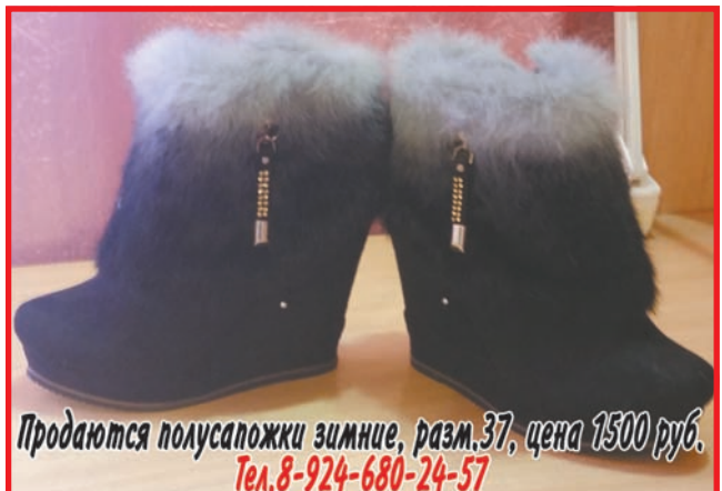
Продаются полусапожки зимние, разм. 37, цена 1500 руб. Тел. 8-924-680-24-57

Женщина, 57 лет, познакомится с порядочным и добрым мужчиной для создания семьи.