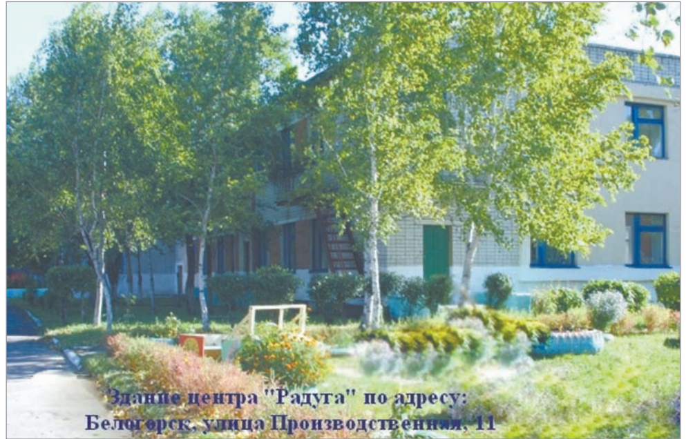
Здание центра «Радуга» по адресу: Белогорск, улица Производственная, 11

социальной реабилитации воспитанников; подготовки и сопровождения замещающих семей; постинтернатного сопровожде-