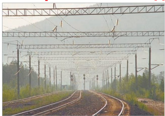
год, размещённым на сайте ЗабЖД, в компании трудится 52 тысячи 161 человек, сообщает «Чита.ру»

Он отметил, что во втором квартале 2015 года станет ясно, какие предприятия каких дирекций затронет оптимизация. По данным на 2013