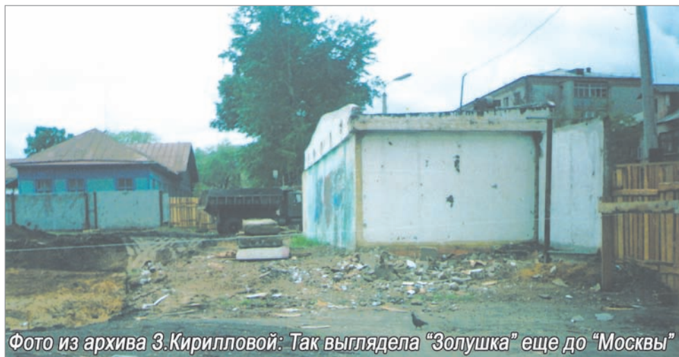
Так выглядела «Золушка» еще до «Москвы»

В 2008 году я вместе с детьми активно участвовала в предвыборной кампании по выборам главы города, обклеивая агитационными материалами и плакатами своё здание закусочной. Тогда я была нужна Администрации Белогорска, так как ежегодно участвовала в проведении городских мероприятий - от лыжни, проводимой в микрорайоне «Амурсельмаш», до празднования Масленицы на центральной площади города. В 2011 году по просьбе дирекции Городского парка я произвела ремонт второго помещения, расположенного под трибуной парка и стала кормить