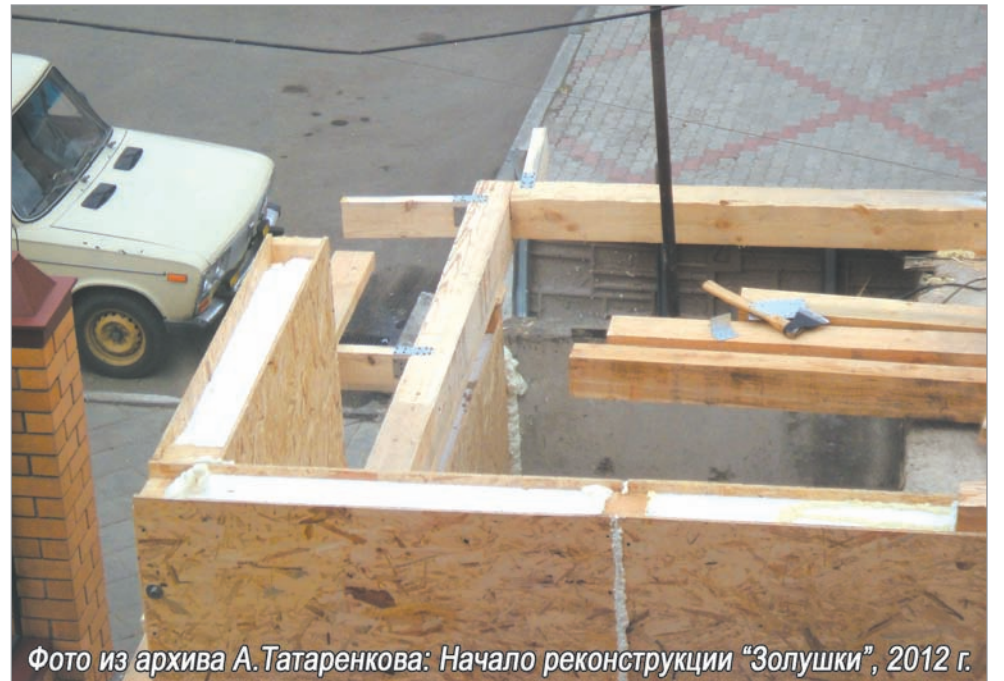
Начало реконструкции «Золушки», 2012 г.