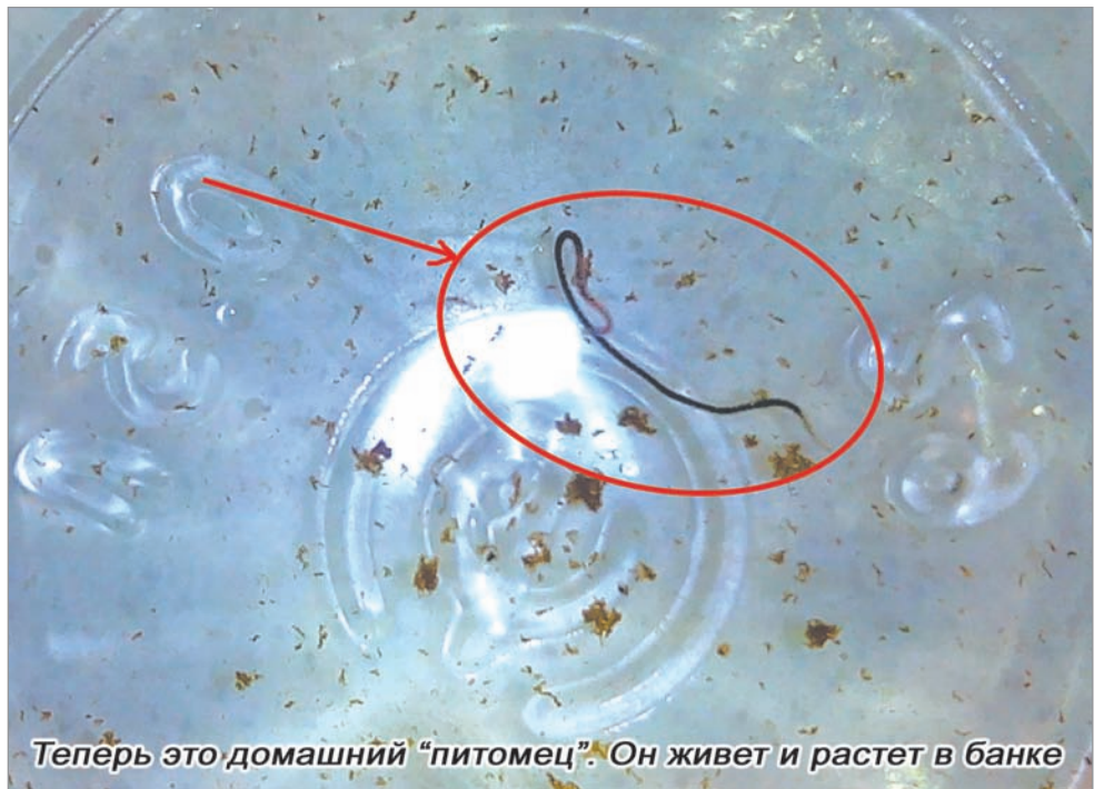
Теперь это домашний «питомец». Он живет и растет в банке

Она говорит, что вариант того, что черви могли развиться на самом фильтре, когда он начал загрязняться, отпадает сразу, потому как из-за того, что вода зачастую бывает грязно-рыжего цвета, мутная, его хватает буквально на четыре дня. После чего его выкидывают, так как он одноразовый, и ставят новый, а это стоит денег. Но в данном случае цель оправдывает средства.