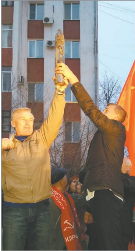
дело Ленина, а также в это время нынешнее поколение покоряет уже «новые миры».

Молодежь прошлого века делилась своими успехами и выражала надежду, что и нынешние комсомольцы продолжают