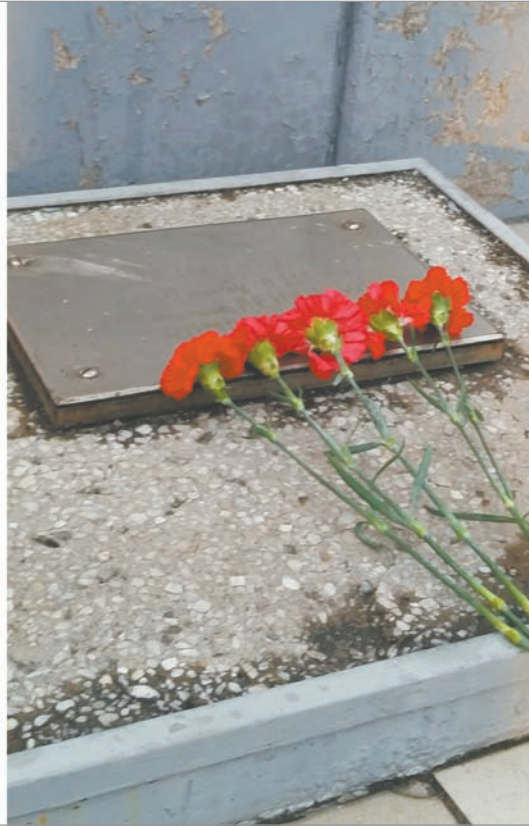
Фоторепортаж и видео на сайте просто-газета.рф

Специалисты ЗабЖД обследовали автомобильный путепровод в Белогорске в районе улиц Северной – Авиационной и выявили ряд замечаний, которые угрожают безопасности движения. Результаты проверки направили в прокуратуру и администрацию Белогорска.