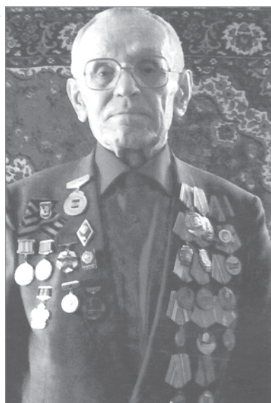
Бюро Белогорского райкома КПРФ

Ветеран труда и Коммунистической партии, почётный житель Белогорского района навсегда останется в памяти всех кого жизнь сводила с этим замечательным человеком, его товарищей, соратников, родных и близких.