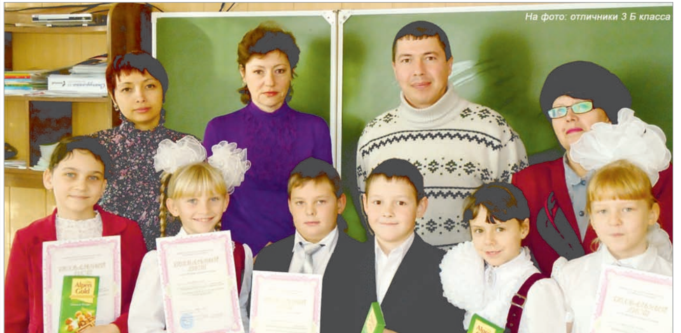
На фото: отличники 3 Б класса

В МОАУ СОШ №1 стало доброй традицией чествовать учащихся, закончивших учебный год на «5». На праздничное мероприятие «Слёт отличников» уже в седьмой раз собрались ребята нашей школы 17 ноября 2012 года.