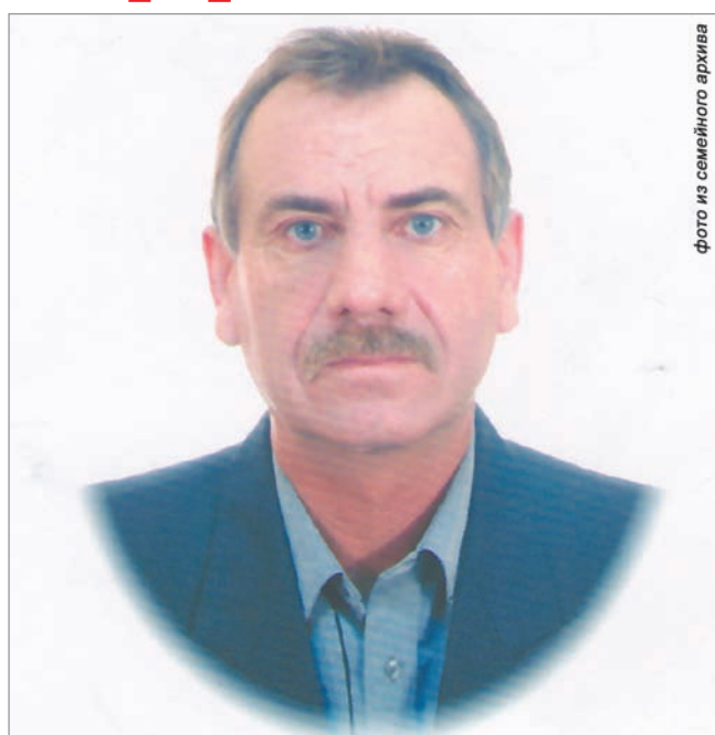
фото из семейного архива