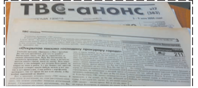
(Газета «ТВС-анонс» № 17 (383) от 28.04.2004 г.)

Судите сами, мы перепечатаем его почти в полном объеме: