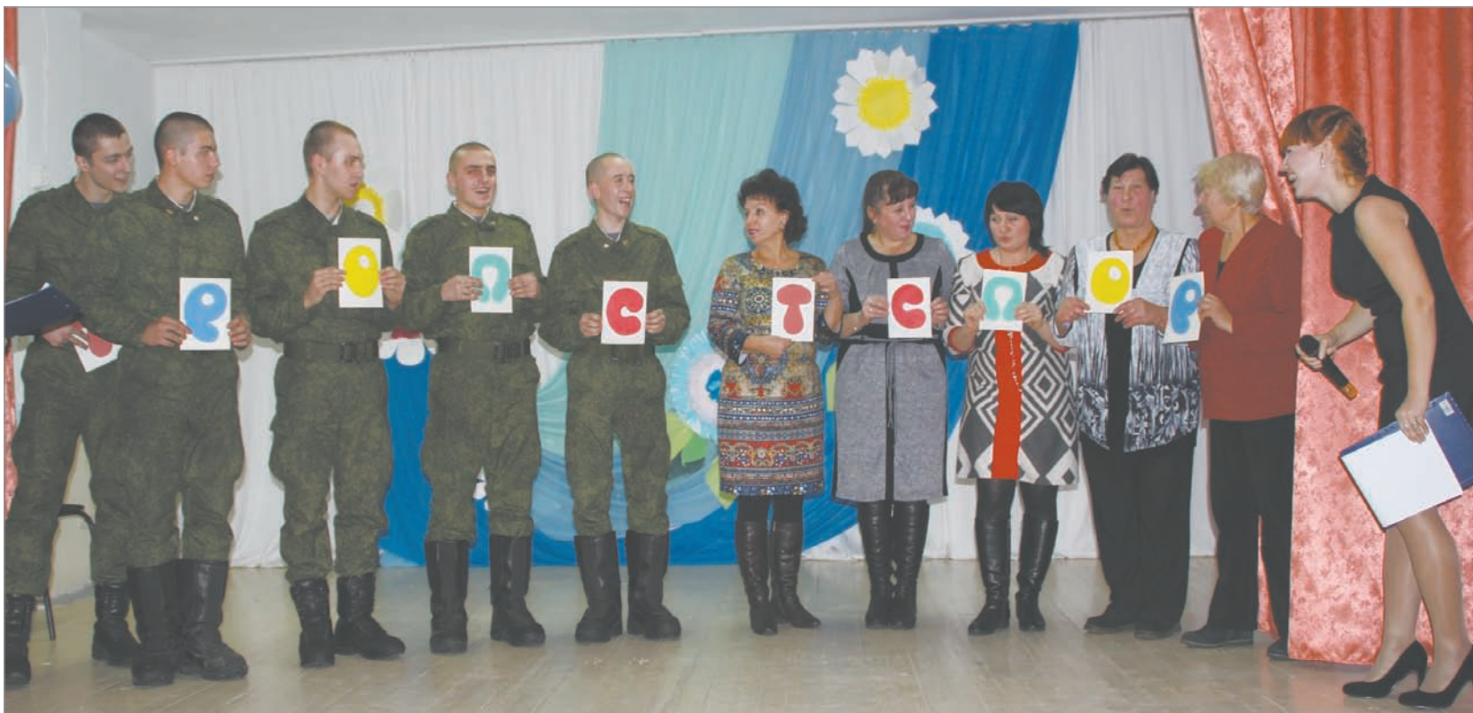
В соревнованиях среди военнослужащих по призыву и мам победу одержали белогорские мамы

День Матери появился совсем недавно. Но за пятнадцать лет он стал одним из самых любимых в нашей стране. Под самый занавес прошлой недели Белогорск отметил День матери. Тематических мероприятий в городе прошло немало, но, пожалуй, самым ярким получился праздник, организованный Комитетом солдатских матерей для мам военнослужащих по призыву.