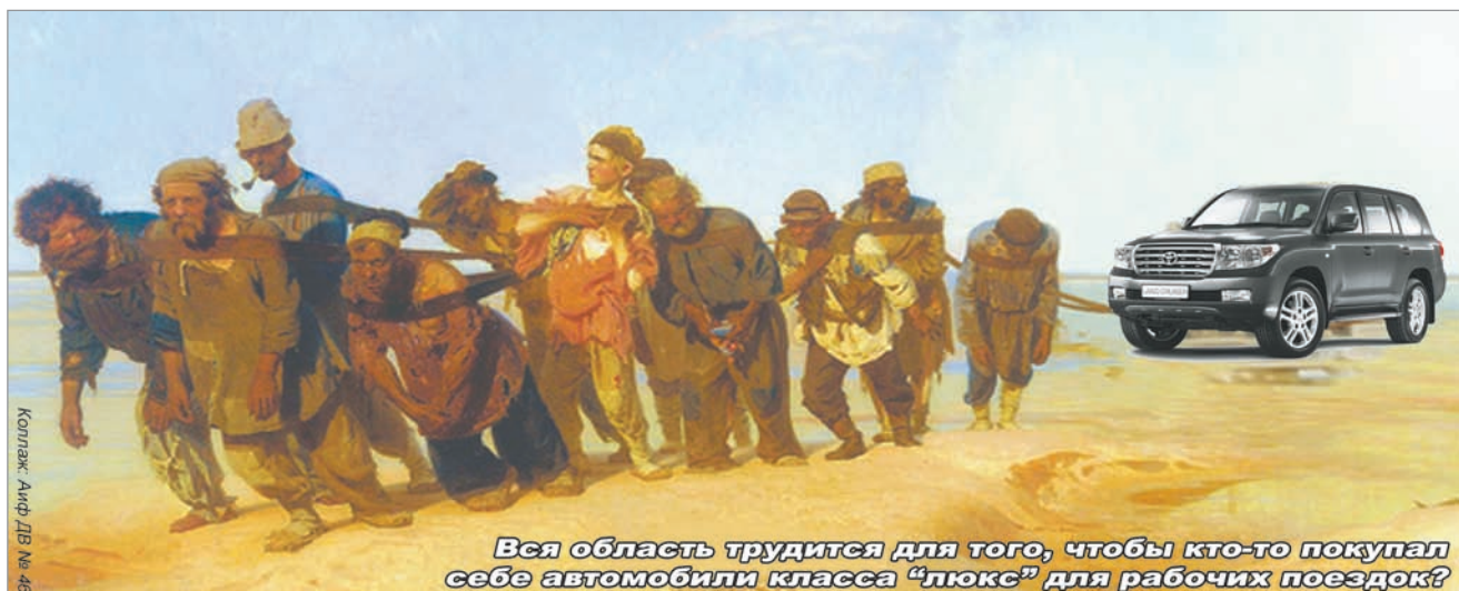
Вся область трудится для того, чтобы кто-то покупал себе автомобили класса «люкс» для рабочих поездок?

9 августа 2013 года директор МУП «Единая диспетчерская служба г.Белогорска» вновь отказал редакции в получении информации, посчитав, что данная информация, в том числе, о цвете автомобиля, не относится к разряду информации, которые должны раскрывать предприятия и вновь пере-