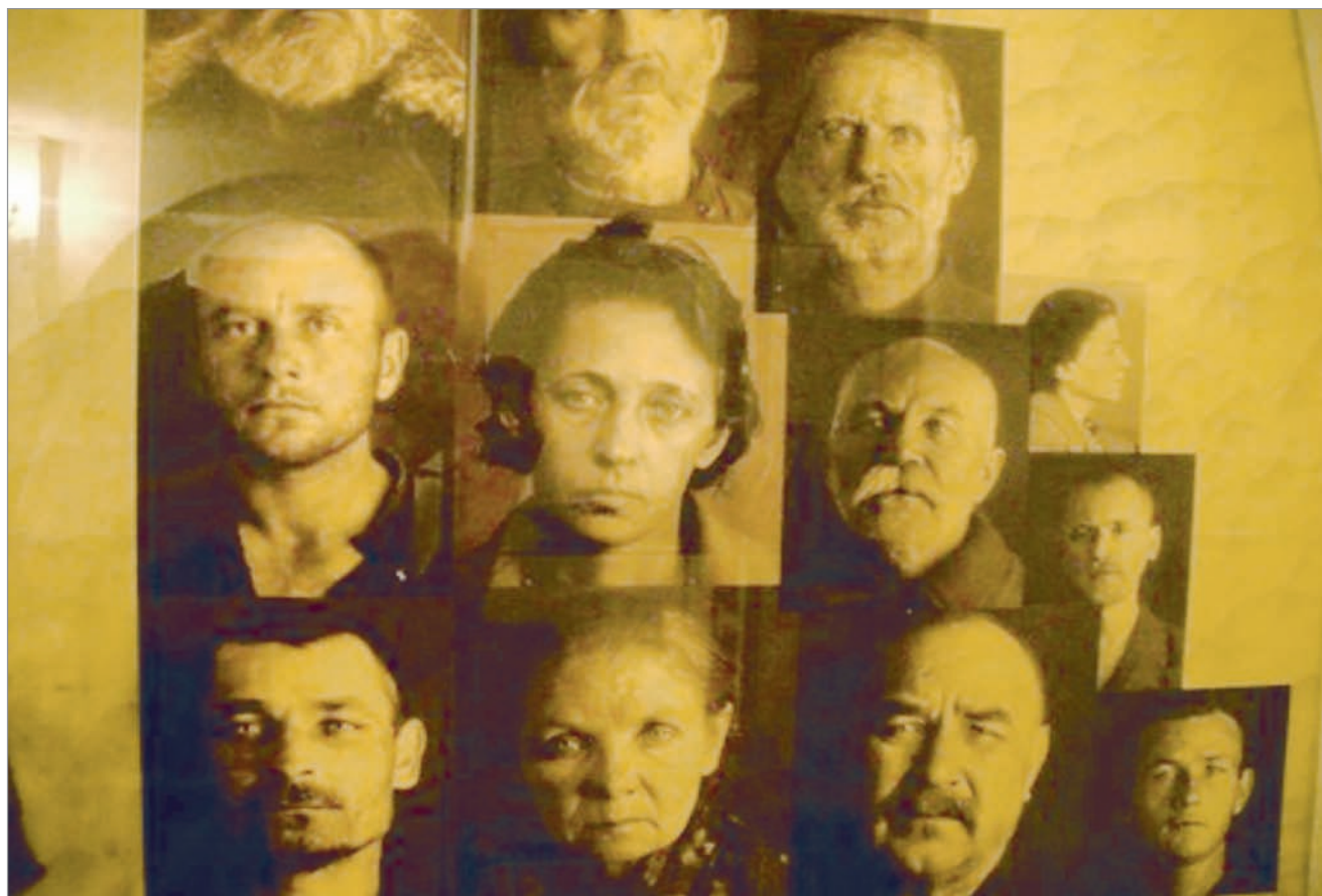
Лица людей, сфотографированных перед расстрелом. Те, кто на них смотрит, говорят: «Не лица, а лики»

Церковь, воспевая в своих гимнах великих древних мучеников, та-