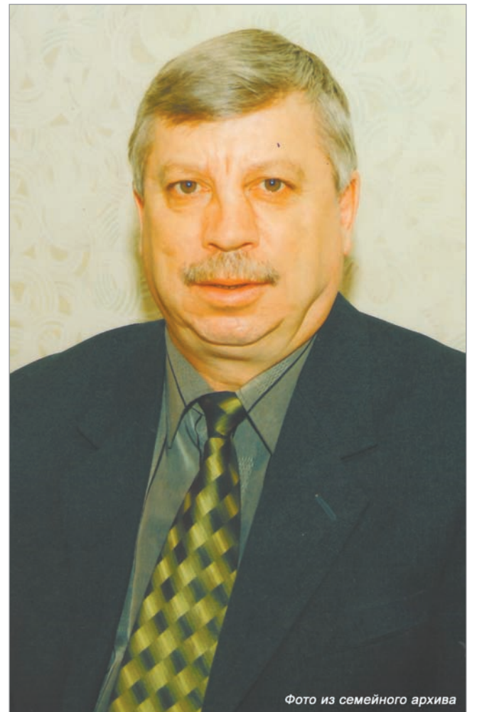
Фото из семейного архива