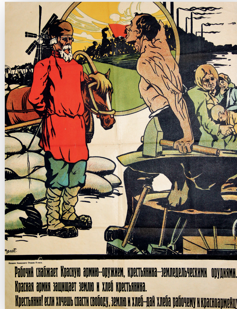
Плакат издательства «Молот». 1922

«Пусть другие там занимаются художественной литературой, – а мы открыли свое хлебное дело. Оно гораздо прибыльней». Рис. А. Радакова, 1920-е