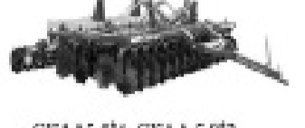
SKA 5,8, SKA 5,872