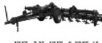
KHT - 7,25, KHT - 9, KHT - 10