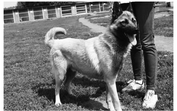
ТЕННЕР , 8 мес, крупный пес, типаж овчарки, умный, смелый, привит. Тел. 8-904-166-89-83, 8-950-649-44-62, сайт pervo-priut.ru

сайт pervo-priut.ru Тел. 8-904-166-89-83, 8-950-649-44-62