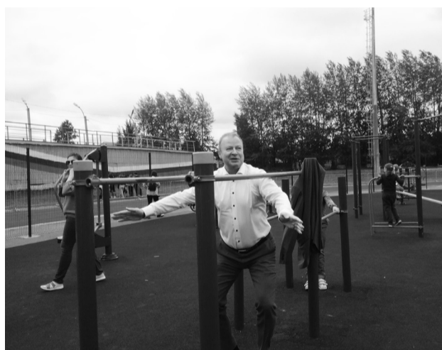
... который сделал несколько упражнений на брусьях и совершил почти что идеальный соскок!