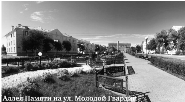
Аллея Памяти на ул. Молодой Гвардии