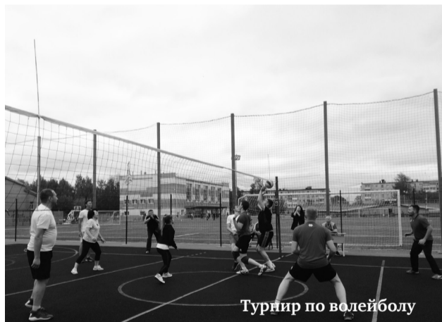
Турнир по волейболу