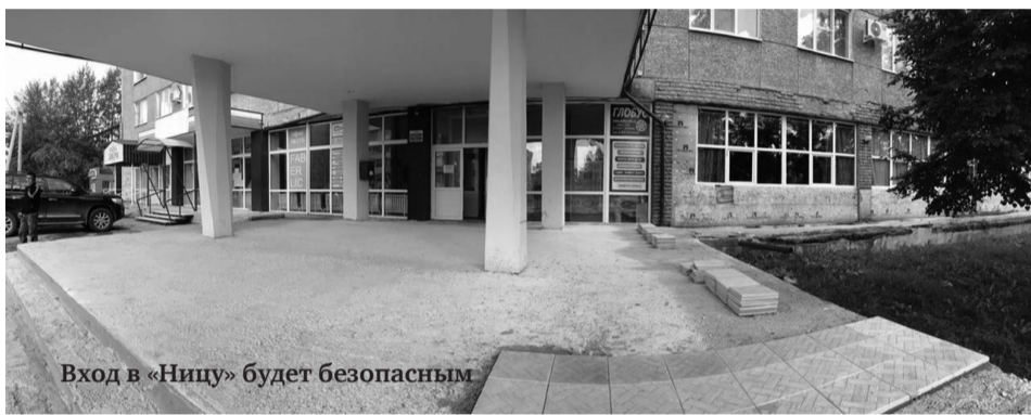
Вход в «Ницу» будет безопасным