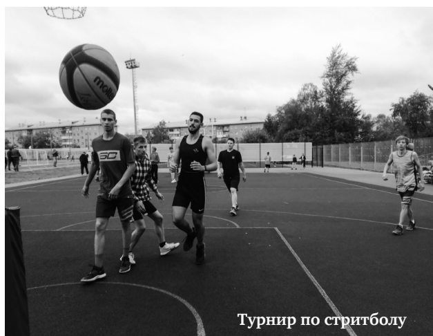
Турнир по стритболу

Стрельба из пневматической винтовки, силовое двоеборье, лёгкая атлетика: бег, эстафета, прыжки в высоту, в длину, блиц-турнир по шахматам. И впервые в Ирбите – турнир по большому теннису! Технические результаты будут напечатаны в следующем номере.