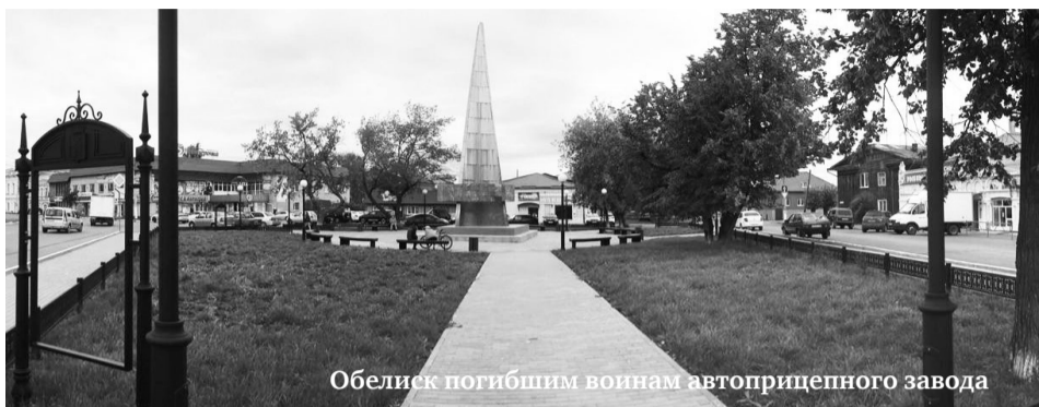
Обелиск погибшим воинам автоприцепного завода