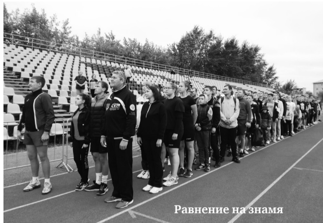
Равнение на знамя

После парадного построения спортсмены в десяти видах спорта показали своё умение, силу, выносливость, азарт и все продемонстрировали большую волю к победе.